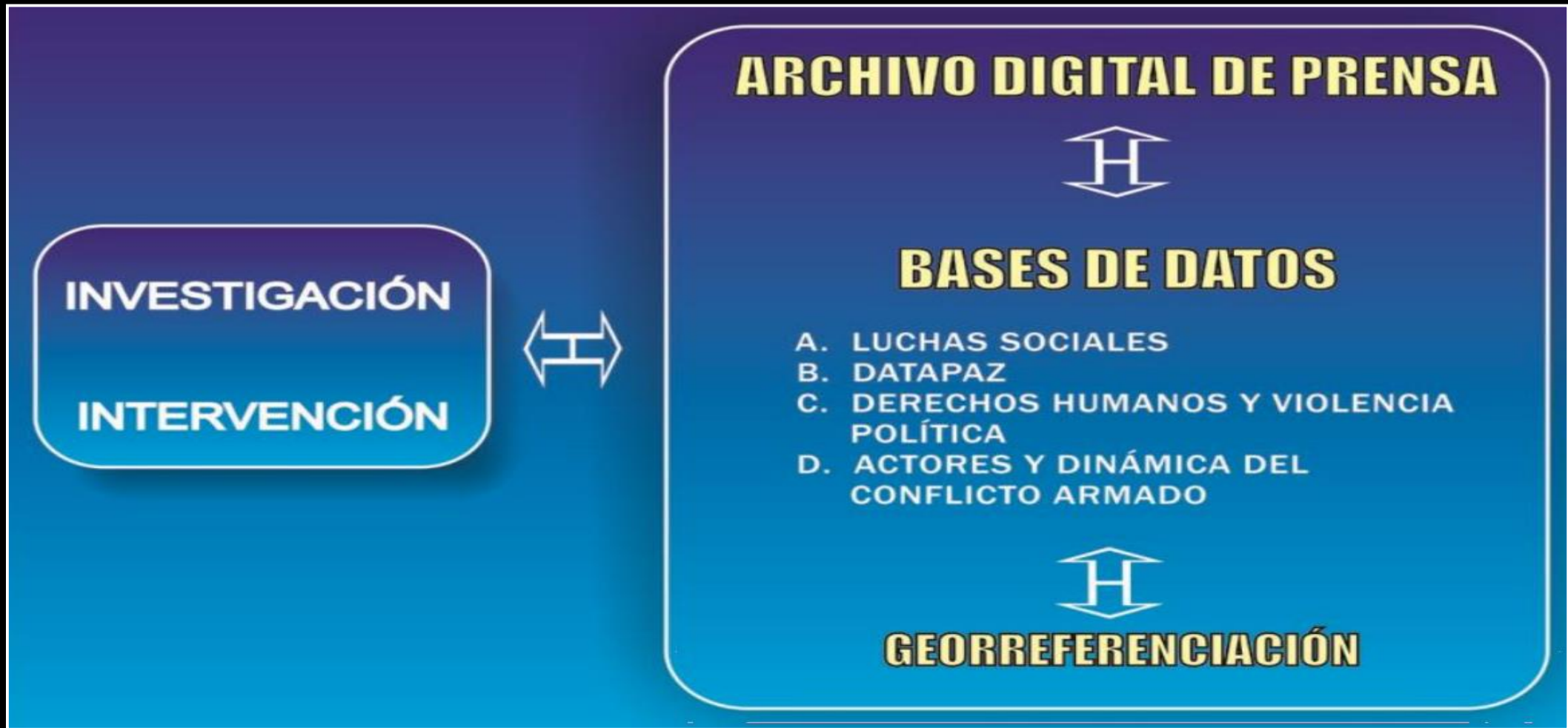
Componentes del SIG-CINEP