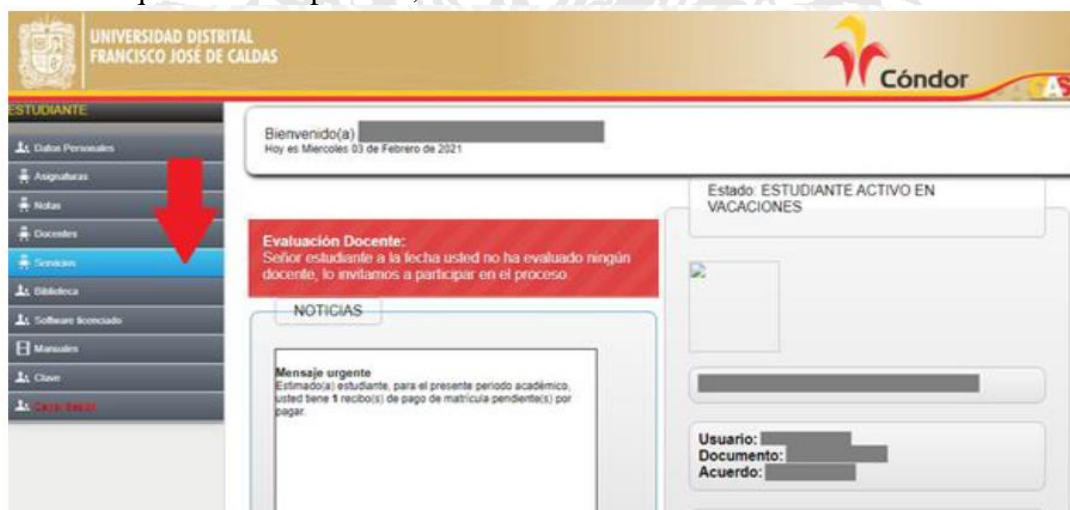
Tomado de: Sistema de Gestión Académica Universidad Distrital Francisco José de Caldas. 2022.