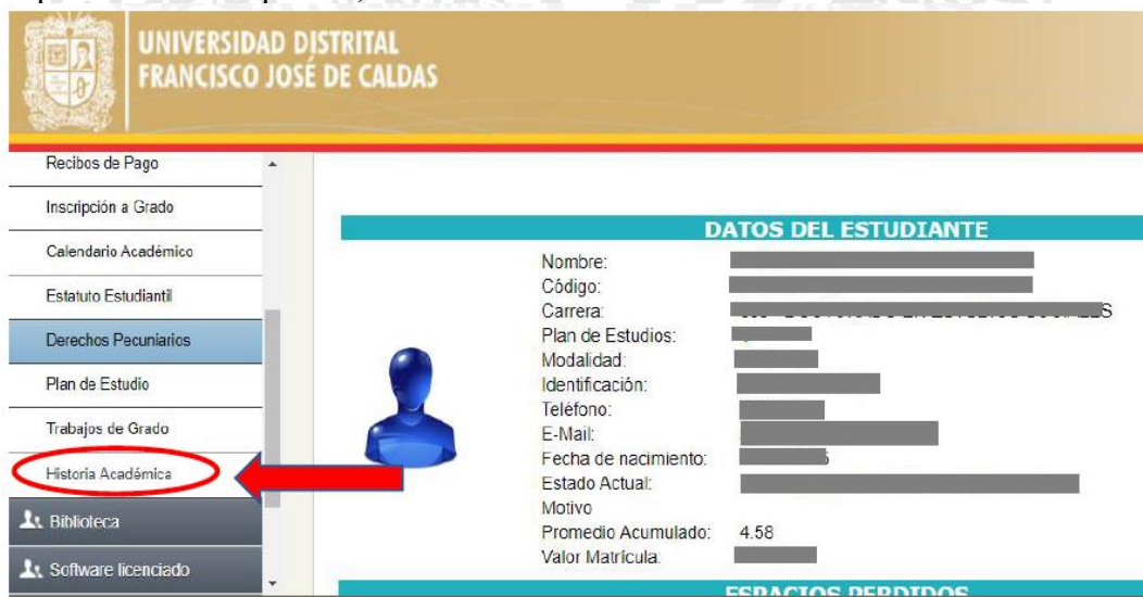
Tomado de: Sistema de Gestión Académica Universidad Distrital Francisco José de Caldas. 2022.