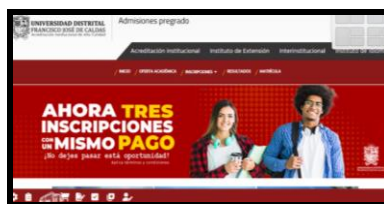
Novedad Proceso de Admisiones 2023

Matrícula cero y Jóvenes a la U. Mediante la implementación del Decreto 1667 de 2021, se define la política de estado de aplicar la gratuidad en la matrícula y los planes de estímulos y alivios para los usuarios de ICETEX. Desde 2021 se aplica dicho programa. Se cuenta también con el programa Jóvenes a la U, de acuerdo con los convenios suscritos con la Agencia Distrital para la Educación Superior, la Ciencia y la Tecnología.