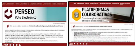
Ejemplo de Módulos de Gestión, UDFJC